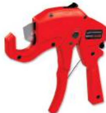
№ 55005 / № 55015