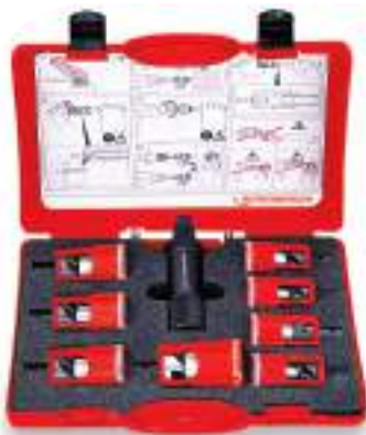
Комплект ROGRAT MSR (МПТ)

Цветовая кодировка для простоты идентификации