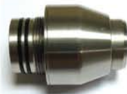
Переходник-адаптер для видеокамеры KK29