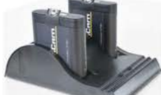
Зарядное устройство для аккумуляторных батарей