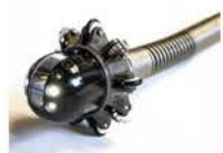
Устройство для поворота камеры в отводы