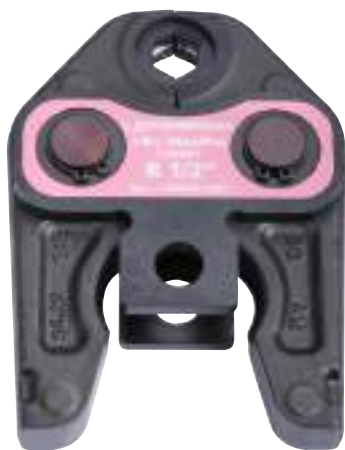
Пресс-клещи для ROMAX 4000 / 3000 AC / AC ECO № 1000001891