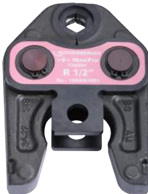
Пресс-клещи для ROMAX 4000 / 3000 AC / AC ECO № 1000001891