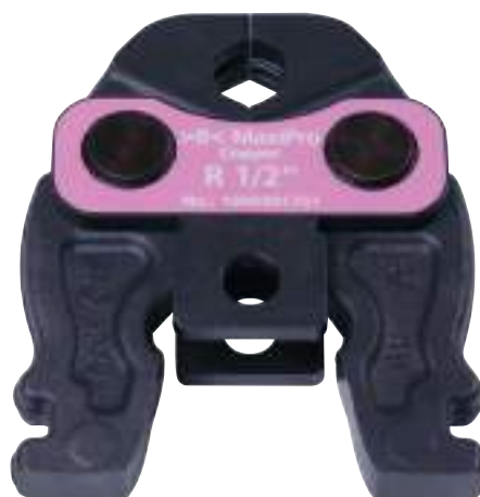
Пресс-клещи для ROMAX Compact TT № 1000001751