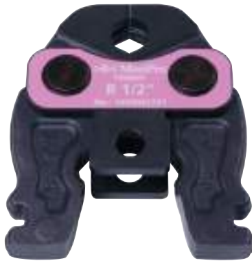
Пресс-клещи для ROMAX Compact TT № 1000001751

Пресс-клещи V< MaxiPro частично подвергаются лазерной закалке в местах приложения наибольшего давления, поэтому они отличаются длительным сроком службы.